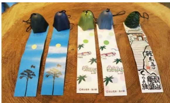
南部風鈴(イメージ)