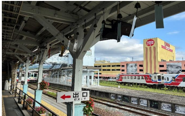
三陸鉄道 宮古駅(ホーム)