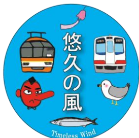
ヘッドマークデザイン