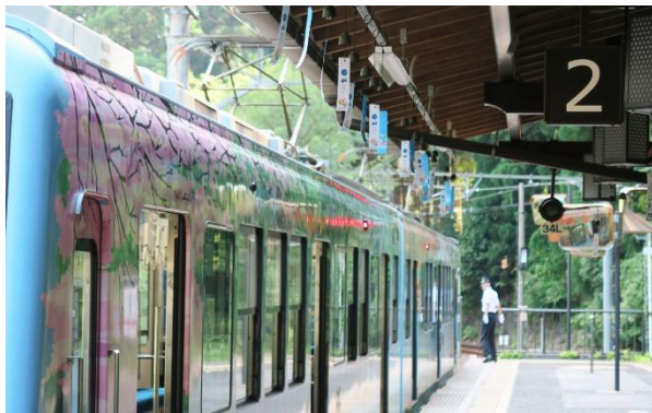
叡山電車 鞍馬駅(ホーム)

叡山電車鞍馬駅(京都市左京区)のホームと待合室に約200個、三陸鉄道宮古駅(岩手県宮古市)に約40個の南部風鈴を飾り付けます。