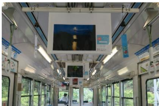
叡山電車 前回展示イメージ