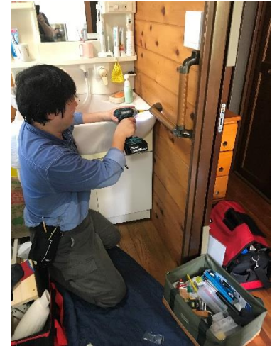
手すりの取り付け作業

介護リフォームは取付けや工事する場所の寸法さえわかれば見積りが出しやすいため、AI の力を借りる事で見積り作業の7、8割が削減できるようになりました。2018年11月にリリースし、現在は直営店で稼働しています。