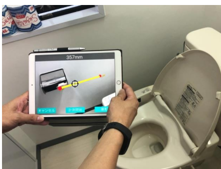
自社開発の見積 AI アプリで、手すりの設置