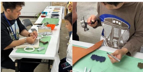
2025 年 5 月 ファミリーレールフェア 2025