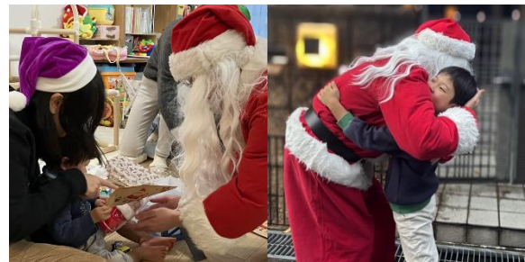
2025 年 12 月 クリスマス スペシャル企画