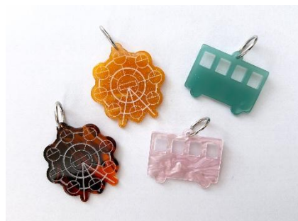
▲オリジナルパーツ

選べる3種類のパーツから、最大4つ好きなものをお選びいただき、キーホルダーを制作します。制作過程は円形カラビナにキーホルダーパーツをつけていくだけの非常に簡単な内容のため、小さなお子さまから大人の方まで楽しんでいただけます。 ※先着順のためキーホルダーパーツがなくなり次第終了。