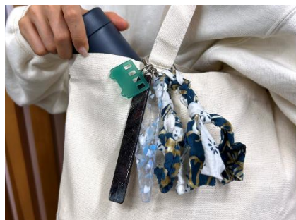
▲ごちゃもりキーホルダー 完成イメージ

なお、この取り組みは、京阪グループが推進する、“SDGsを実現するライフスタイル”を企画・提案する「BIOSTYLE PROJECT」の一環です。