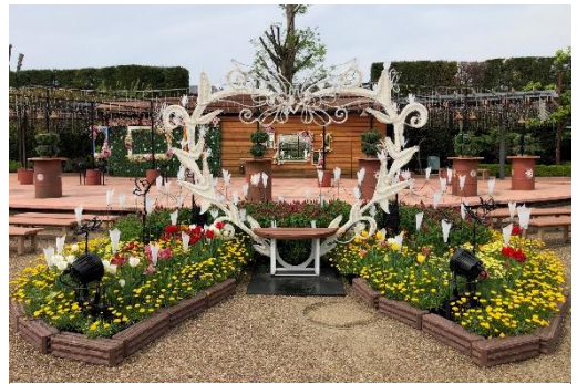
ハートのフォトスポット