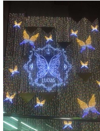
アポロビル・ルシアスビル