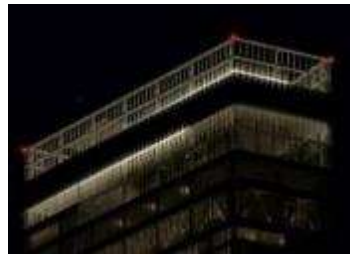
①トゥインクルライト