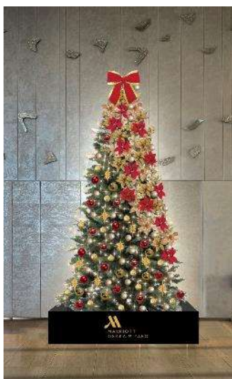
④大阪マリオット都ホテル 19階ロビー