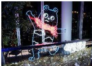
②ハルカス300（展望台） 58階天空庭園