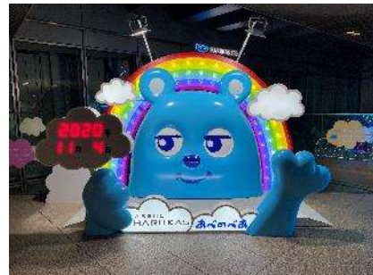
⑨2階シャトルエレベーター付近