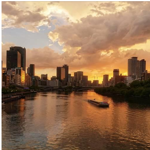
夕日の中を走る船