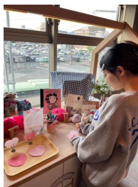
ハートの絵馬に 悩みや思いを書き記せます。

この神社に願いをかけられるのは、女性専用宿泊施設、CAFETEL の宿泊者だけです。鳥居の中央部にみんなの恋バナを応援する、「恋絵馬」が掛けられるようになっています。自分のなやみだけでなく、全国・各国の女子たちがどんな恋の想いを抱えているかを知りあえば、恋バナはますます盛り上がり、元気が湧くことまちがいなし！