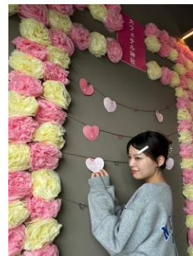
カフェテル神社に絵馬をかければ、スタッフからおへんじが。