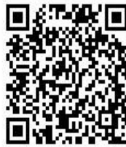
X (旧 Twitter)