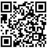
X (旧 Twitter)