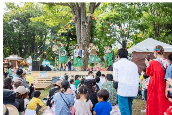
「Yokohama Nature Week 2023」開催時の様子