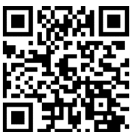
X (旧 Twitter)