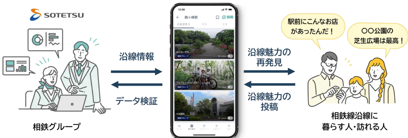
「ekinote」と「地域振興プラットフォーム」のイメージ