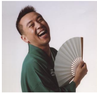
林家たい平さん[落語家]