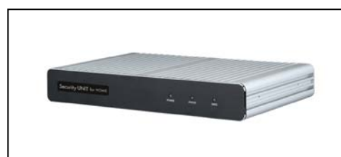
HOME セキュリティパック「type-U2」の セキュリティユニット

キヤノンMJは、2009年12月からクラウド関連事業の中核サービスとして中小オフィス向けIT支援サービス “HOME” を提供してきました。“HOME” は、セキュリティサービス「HOME-UNIT」及び、グループウェアサービス「HOME-PORTAL」、クラウドストレージサービス「HOME-BOX2」、リモートヘルプデスク「HOME-CC」から構成されています。