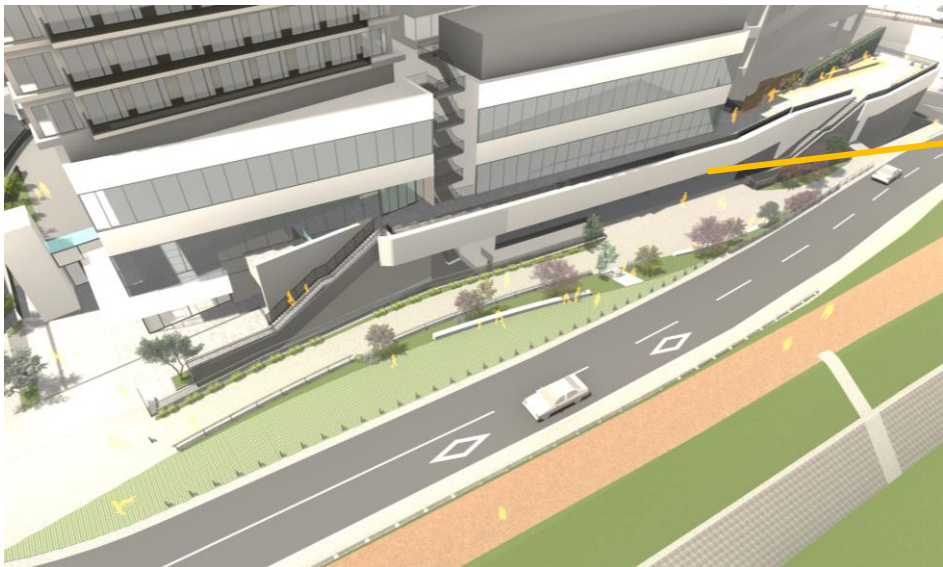
ステーションヒル枚方北東側 天野川沿いエリア

まちとの回遊性を高めて、居心地が良く、歩きたくなるまちづくりを推進するために、まちと施設がつながるポイントに設置した「でんしゃみち」。