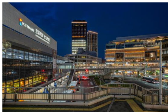
「ステーションヒル枚方」外観