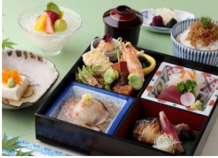
「カウンター割烹 みおつくし」 季節の松花堂弁当