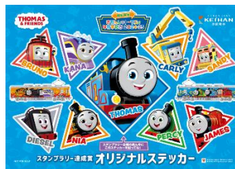
オリジナルステッカー