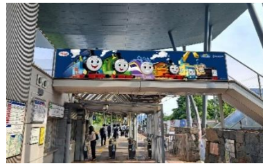
坂本比叡山口駅 駅装飾