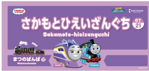
駅名看板(坂本比叡山口駅)

駅名看板をトーマスデザインにします。ぜひ、スタンプラリーと合わせてお楽しみください。