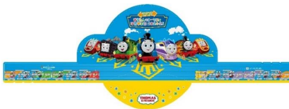
オリジナルサンバイザー