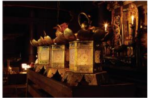
▲比叡山延暦寺の根本中堂（国宝）