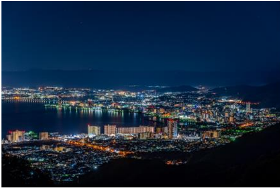
▲比叡山から望む夜景

※悪天候時は催行を中止する場合があります。 ※新型コロナウイルス感染症拡大防止対策として、手指消毒やマスク着用にご協力ください。 ※詳細は、京阪電車主要駅等で配布するパンフレットのご確認をお願いいたします。