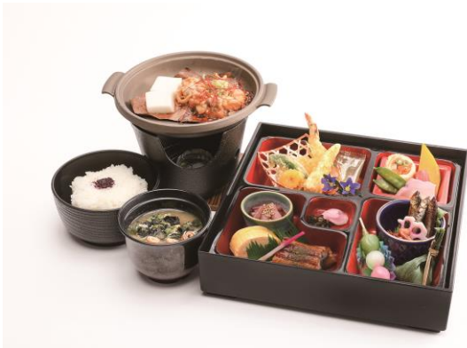
▲峰道レストランでのお食事