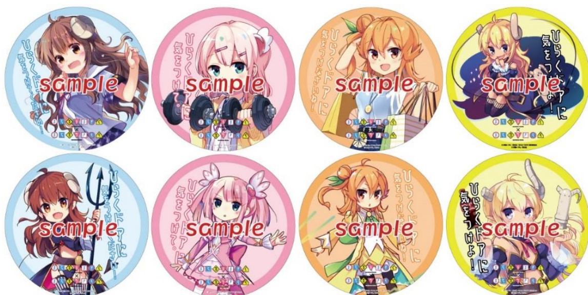
ドアステッカーのイメージ