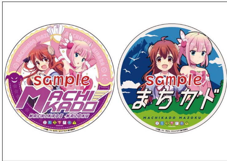
コラボヘッドマークステッカーのイメージ