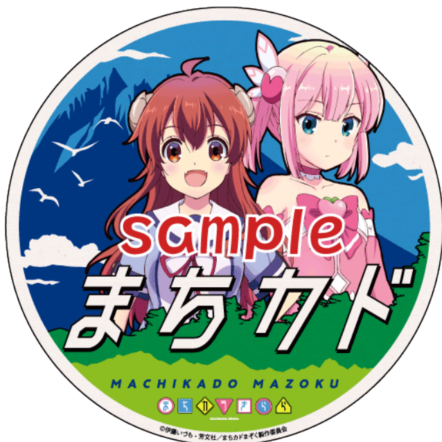
コラボヘッドマークのイメージ