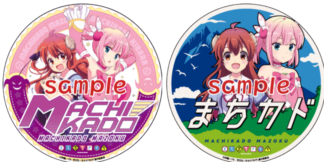
コラボヘッドマークのイメージ