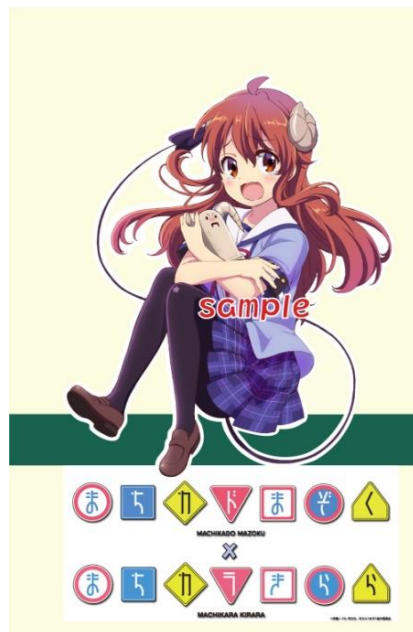
側面ラッピングイメージ