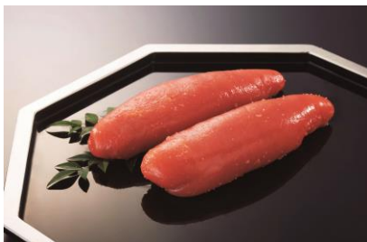
福岡<稚加榮本舗> 太もの明太子