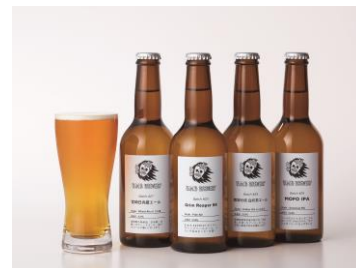
宮崎<B・M・B Brewery> クラフトビール各種

唐揚げ専門店発祥の地、大分県宇佐の名店が初出店。独自の製法で作られた唐揚げは、外はカリカリ、中はジューシーで、一度食べたら病み付きになる味です。