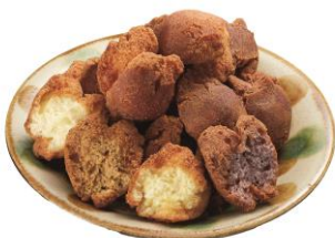
<三矢本舗> サーターアンダギー

宮崎の素材を生かしたクラフトビールが楽しめます。今しか飲めないオンリーワンのクラフトビールをぜひ会場で。