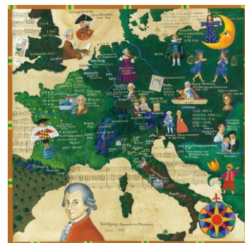
「旅するモーツァルト」