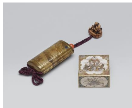
左:沃懸地 京名所蒔絵印籠 右:薩摩 唐子文四方香合

会期 9月5日(木)～9月11日(水) ※最終日は17時閉場 内容 長きにわたり、大切に受け継がれてきた華麗なる日本古美術の数々。海を渡り世界の人々を魅了してきた古伊万里、精緻な技が光る薩摩焼や蒔絵。古窯の壺や浮世絵作品まで、日本古美術の逸品約100点を取りそろえ展示販売します。