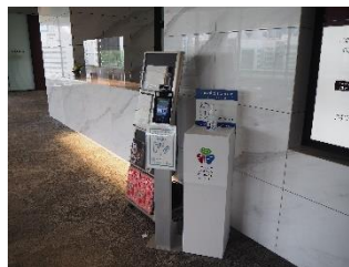
入口での検温・消毒の実施