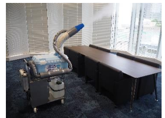
定期的な消毒作業