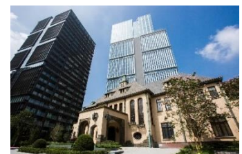
東京ガーデンテラス紀尾井町