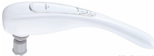
※ 製品の画像はイメージです。実際の製品の色とは多少異なる場合がございます。

美容家電や調理家電などの開発及び製造を行うテスコム電機株式会社(本社:東京都品川区 代表取締役社長:楠野 寿也)は、2つのアタッチメントで、肩から足まで幅広い部位をマッサージできる「ハンディマッサージャー TMS100」を2019年5月28日(火)に発売します。