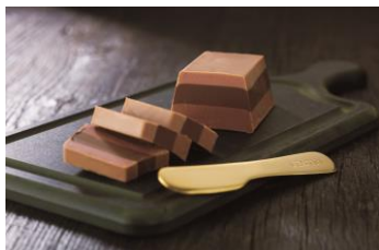
＜ヴェストリ＞ リンゴット・ランポーネ

(95g) 1,501円 ローストしたアーモンドをルビーチョコレートで包み、ラズベリーパウダーでコーティング。香ばしさとほのかな甘酸っぱさのハーモニー。