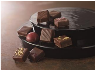
＜ベロ エ アンジェリ＞ トゥールーズ ベストアソート

(5個入) 2,160円 ハートのグラデーションが美しく並んだ新作「グラデーション クール」シリーズの詰め合わせ。色とりどりの味わいをお楽しみください。