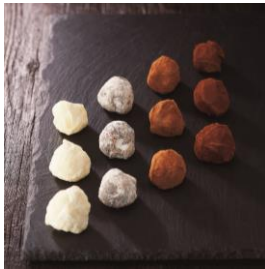
＜イヴァン・ヴァレンティン＞ イヴァントリュフ

(12個入) 6,687円 ハリウッドのセレブリティに愛される＜イヴァン・ヴァレンティン＞がこだわるのは、人々を幸せにするスイーツの追及。チョコレートのピュアな美味しさが、あなたの味覚を虜にします。