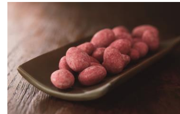
＜ピーター バイヤー＞ ラブバイト ルビー

(15個入) 5,616円 この時期だけのハート型パッケージに、2020年限定レシピと定番人気のチョコレートを詰め合わせました。