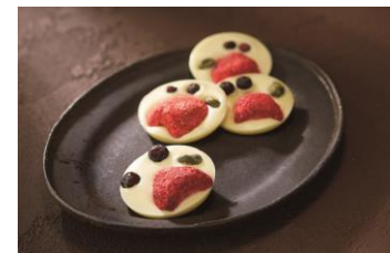
＜レ・カカオ＞ マンディアンフレーズ

(7個入) 2,916円 バレンタインだからこそ伝えたい素直な気持ちを「ナチュール」という言葉に込めて。パッケージにはスイス伝統のお祭りを描写しました。