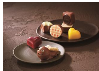
＜レダラッハ＞ ナチュール スイス

(1個、ナイフ付) 2,592円 濃厚な口融けのジャンドウイアチョコレートをラズベリー風味に仕上げ、金の延べ棒に見立てたクレミーノ。付属の＜ヴェストリ＞オリジナルナイフで切り分けてどうぞ。