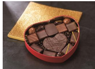
＜ラ・メゾン・デュ・ショコラ＞ ハート ギフトボックス S1

(9個入) 3,801円 ＜ベロ エ アンジェリ＞が店を構えるフランス・トゥールーズ近郊の養蜂場から取り寄せたはちみつなど、地元産素材をメインに使用したチョコレートです。