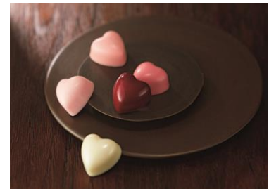
＜ピエール・マルコリーニ＞ グラデーション クール

ボヌールダンルプレ 5,400円 今季のコレクションテーマは、「幸せは草原の中に…自然とともに」。期間限定ショコラ6個を含む、かわいらしいアソートです。