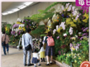
・ディスプレイ展示