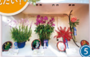
・内閣総理大臣賞受賞ラン展示