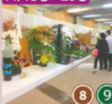
・フラワーデザイン展示