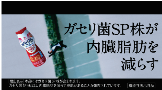
向井理さんナレーション 「ガセリ菌SP株が内臓脂肪を減らす」