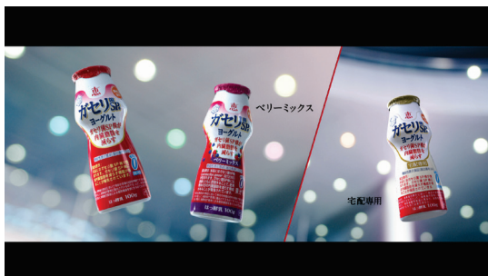
向井理さん 「恵 megumi ガセリ菌SP株 ヨーグルト」