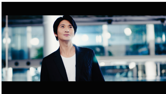
向井理さんナレーション 「ガセリ菌SP株が内臓脂肪を減らす」