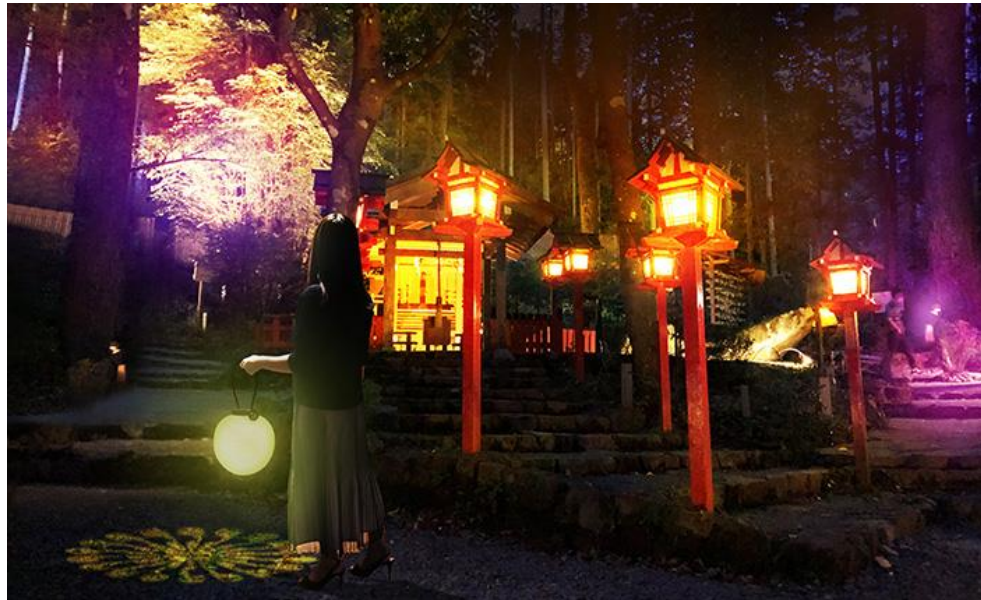
貴船神社結社のイメージ