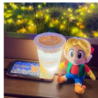
携帯のライトで照らした様子