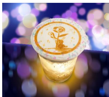
キラキラ推し色ソーダ