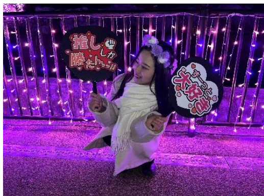
園内のイルミネーションを背景に撮影