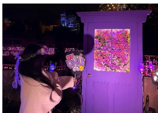
自分でつくったうちわを持って撮影