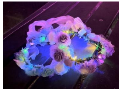
ライトを点灯した様子