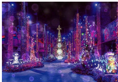
高さ約13mの巨大ツリー「花と妖精のツリー」

WEBサイト： https://www.hirakatapark.co.jp/illumination/