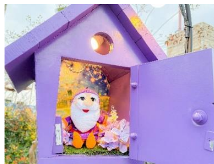
ぬいぐるみを置いて撮影した様子