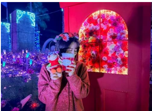
イルミネーションスポット、ドリンク、身に着けるアイテムを推しカラーに統一して撮影