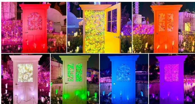
推し活イルミの各扉の正面