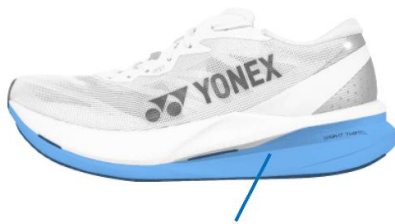
FEATHER LIGHT X

ヨネックス最軽量ミッドソール素材「フェザーライトエックス」をミッドソール下層に採用。長距離走行のエネルギーロスを軽減し、軽やかな走行感を実現。