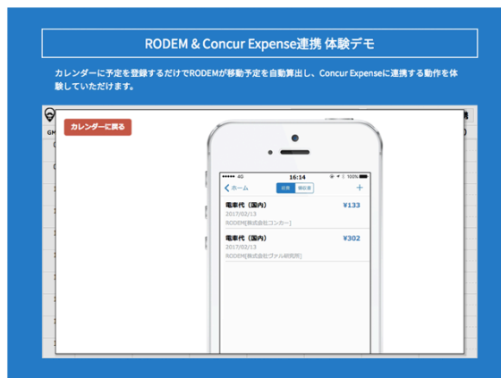
体験デモコーナーのイメージ画像