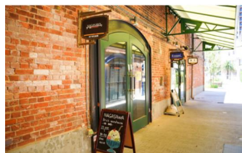
△ NAGASAWA 神戸煉瓦倉庫店

明治15年の創業以来、140余年にわたり文具・事務用品専門店として地元神戸を中心に多くのお客様にご利用いただいております。近年では、手書きの文化を伝えるオリジナル品の企画・販売に取り組んでいます。