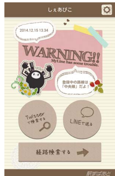
お使いの路線にトラブルが発生？