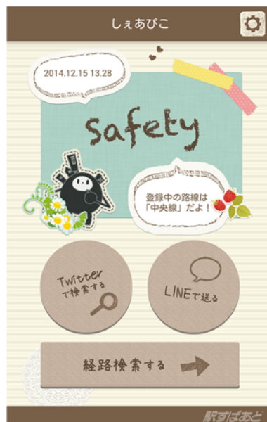
お使いの路線は特に問題ないようです。