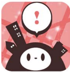
しえあぴこアイコン

「しえあぴこ」は、ヴァル研究所が独自に研究開発したツイート解析を活用し、いつも使っている電車で遅れなどが発生したときに、いち早く察知してあなたにピコーンとお知らせするAndroidアプリです。