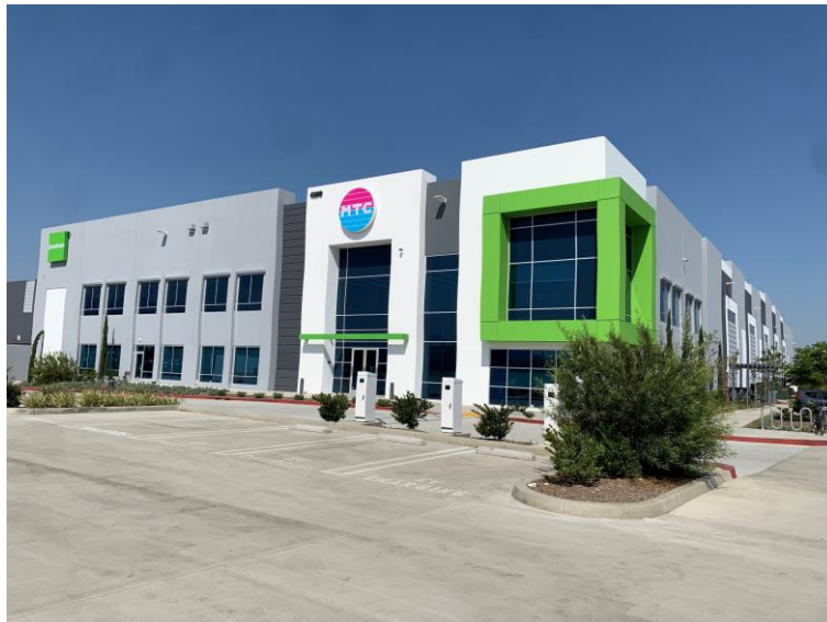
【ミューチャルトレーディング社 本社外観】