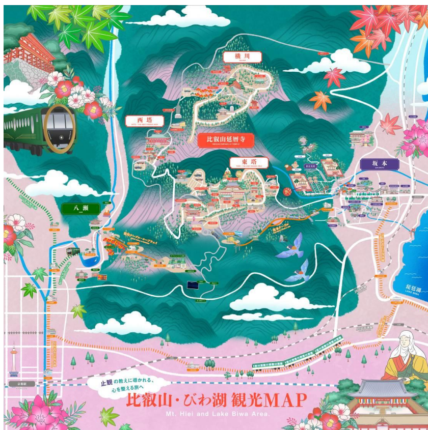
デジタルイラストマップ 画面