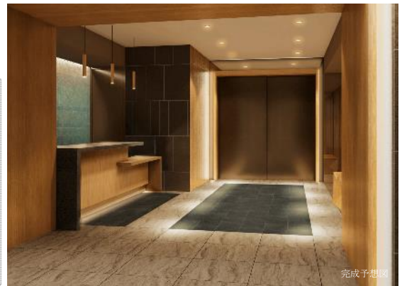
コンシェルジュデスク

※サービス内容は変更もしくは中止になる場合がございます。また、サービスは時間や内容によっては、お受けできかねる場合がございます。一部有料となるサービスがございます。