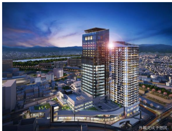
再開発事業全景 (左:ホテル・オフィス棟 右:THE TOWER HIRAKATA)