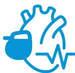
不整脈 (リズムデバイス関連)