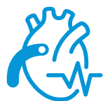
不整脈 (EP/アブレーション関連)

会員登録をいただくと、 7つの専門領域ごとに様々なコンテンツや機能をご利用いただけます。