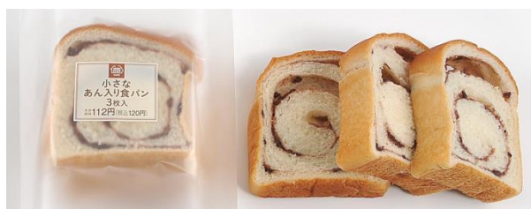
小さなあん入り食パン