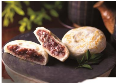
<かさの家> 梅が枝餅(5個)