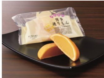
<博多西洋和菓子 明月堂> 博多通りもん(5個入パック)

香ばしく焼き上げた梅の印の太宰府名物。毎月25日にしか作られない「よもぎ入り」(5個 651円) ※各日50セット限定・一人1点限りも登場します。