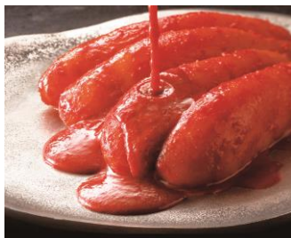
<味の明太子ふくや> 辛皇(ホットエンペラー)