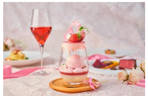
▲いちごパフェ付き限定ディナーコース イメージ

【HP】 https://www.bestbridal.co.jp/restaurant/event_base/pink-ribbon-2022/?restaurant=vino-buono