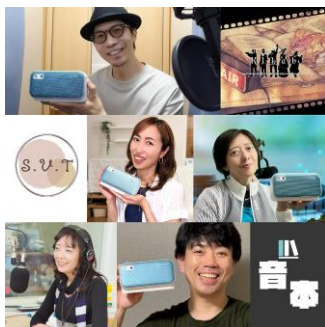
「音声コンテンツクリエイターとのタイアップ」

treVolo U はこれまで、10名を超えるラジオアナウンサーや朗読配信者といった音声コンテンツのクリエイターにお試しいただき、おすすめの使い方を紹介する特集ページを弊社ホームページで公開するなど、声のある生活に寄り添うスピーカーとして発信を続けて参りました。6月には声優の小岩井ことり様のネット番組「ことりの音」でご紹介頂き、同時に開催したプレゼントキャンペーンでは800件を超える視聴者様にご応募をいただきました。2年目も treVolo U は関連クリエイターとのタイアップを通じ、『「聴く」がもっと楽しくなる』体験をお届けしてまいります。