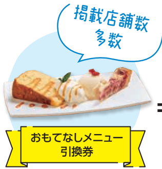
掲載店舗数 多数 おもてなしメニュー 引換券