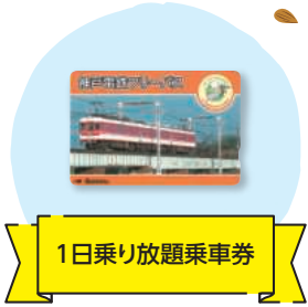
1日乗り放題乗車券