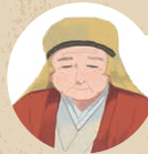
はなわ ほきいち 塙 保己一 (1746-1821・本庄)