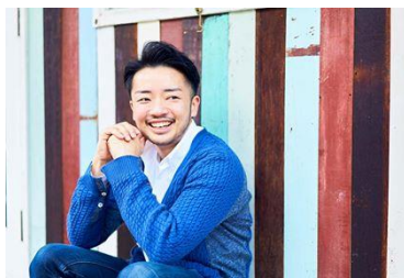
NPO 法人東京レインボープライド 共同代表理事 /