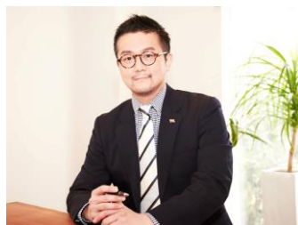
「プライドハウス東京」コンソーシアム代表 /