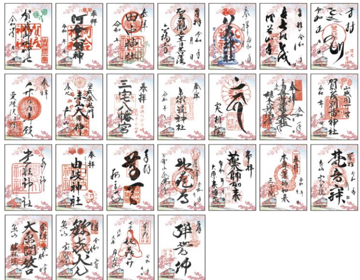
《春の特別ご朱印イメージ》