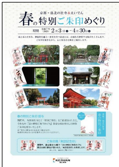
《春の特別ご朱印めぐり》