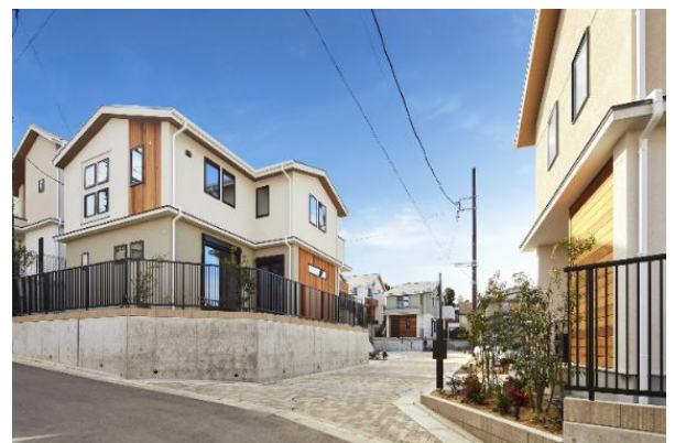
グレースアライフ横浜いずみ中央 (外観)