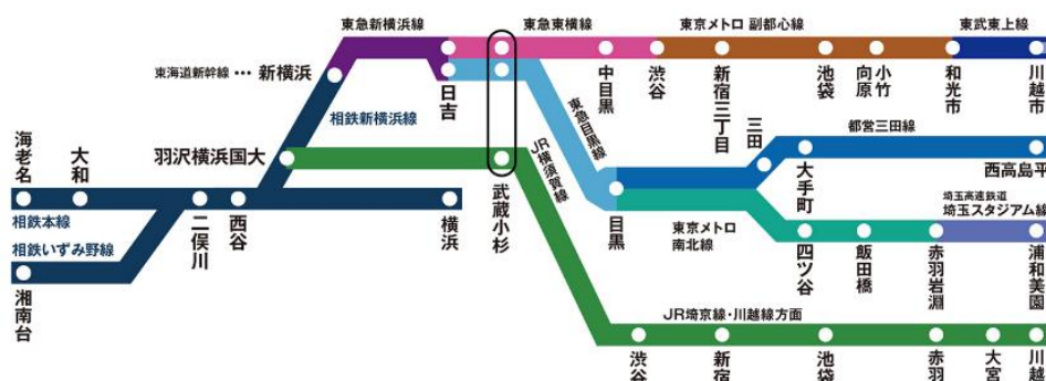
都心直通で便利になった相鉄線沿線