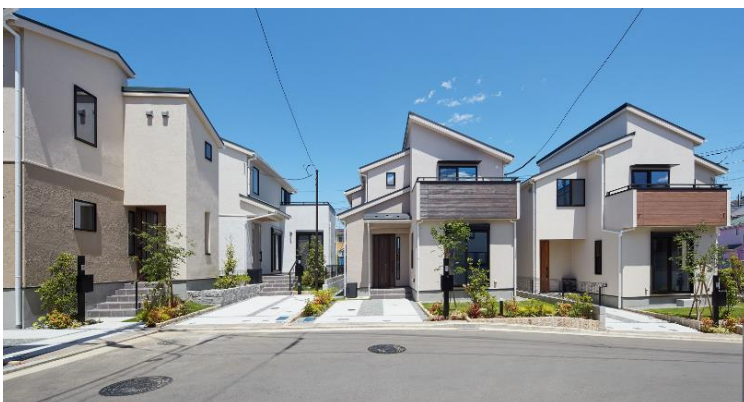
グレースアライフ横浜三ツ境 (外観)