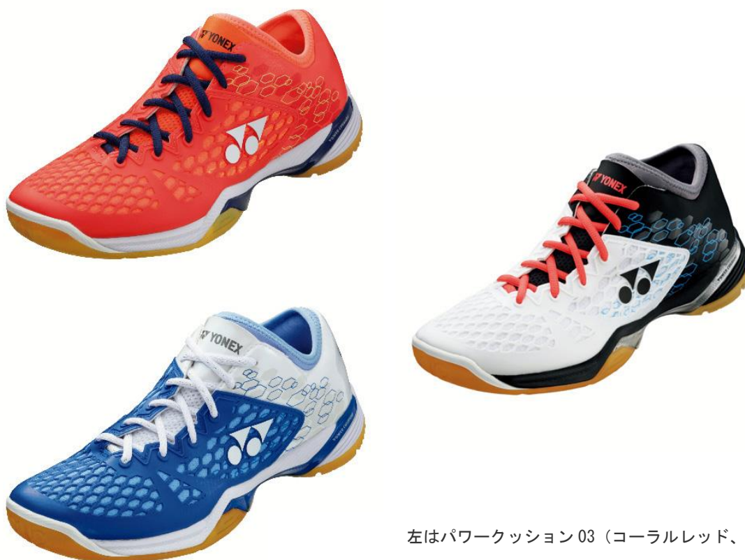
左はパワークッション03（コーラルレッド、ライトブルー）