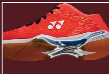
シャンク部スタビライザー