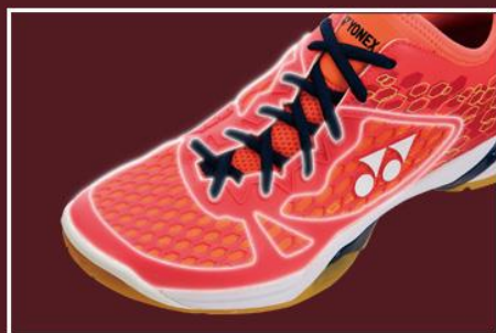
デュラブルスキン

耐摩耗性、保形力に優れる素材。これを前足部の内側・外側・中央部で剛性を変え、各部位に求められる性能を高めました。また、シャンク部にある補強パーツ（スタビライザー）をつま先部～カカト部まで大型化し、激しいフットワーク時の横ブレを抑えます。