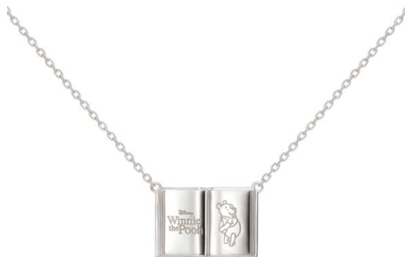
© Disney. Based on the "Winnie the Pooh" works by A.A. Milne and E.H. Shepard.

たっぷりのはちみつに、ちょこんと乗っかるプーさん。幸せあふれる笑顔を見つめるたび、ほんわか癒されるよう……。にっこり顔やトレードマークの丸いおしりも繊細に表現。プーさんの魅力をどの角度からも楽しめる、可愛さいっぱいのデザインです。 税込価格・素材：14,300 円（シルバー950,イエローゴールドコーティング）