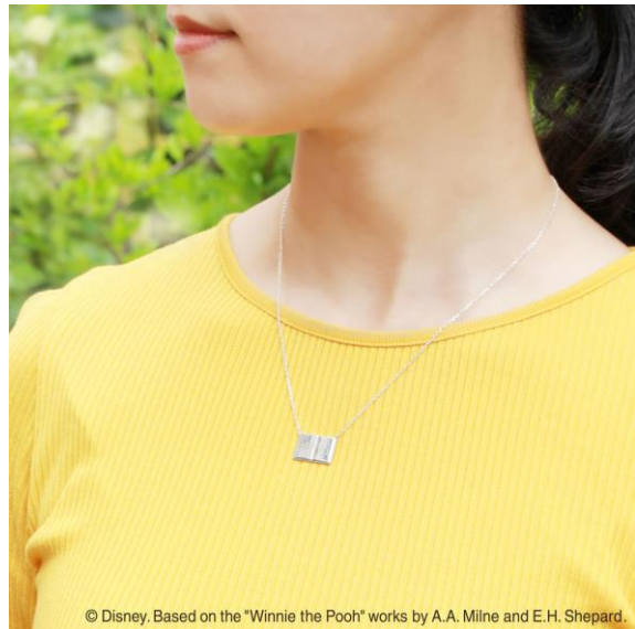
© Disney. Based on the "Winnie the Pooh" works by A.A. Milne and E.H. Shepard.