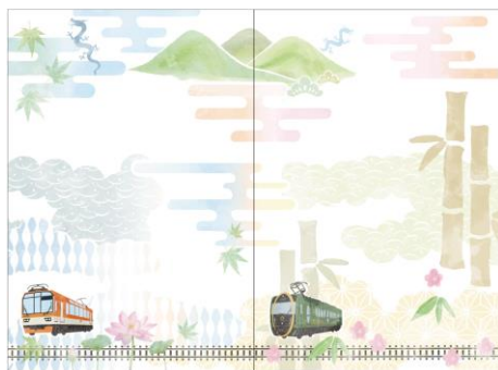
〔第二節〕特別台紙 〔第一節〕特別台紙