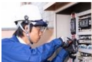
産業用ヘルメットに装着可能