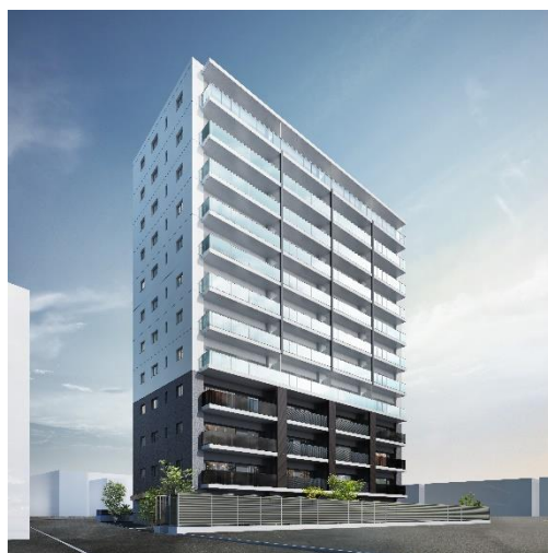
「グレースシアさがみ野マークス」(イメージ)

同物件は、2021年3月に開通した東名高速道路「綾瀬スマート IC」から車で約5分の立地にある他、相鉄本線「さがみ野駅」から徒歩9分の場所に位置する交通利便性の高いエリアであり、マンションではなかなかできなかったタイヤの交換や保管など、カーライフサポートに特化した共用部により、スマートなマンションライフを提案するものです。