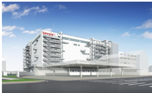
「関西キューポート」完成イメージ

キューピーは、西日本におけるチルド加工品の製造を担う、生販物一体型の拠点「関西キューポート」を2020年1月に竣工し、2月に開所、3月から順次生産を開始します。伊丹工場(兵庫県伊丹市/1938年3月~2019年11月)跡地に開設する関西キューポートは、卵加工品・惣菜の生産を主軸に、周辺に点在するグループ各社の営業・物流部門を集約した、生販物一体型の拠点です。集約することで各部門間のシナジーを生み出し、西日本エリアの市場に対して提案力を向上させながら、生産・販売・物流のあらゆる面で合理化・効率化を図っていきます。