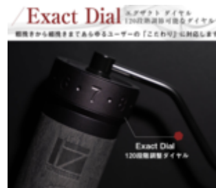
120段階粒度調整機能