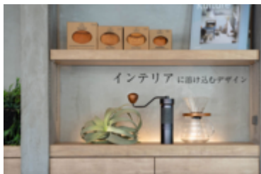
インテリアにもなる製品美