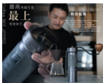
最高を超える最上を求めて