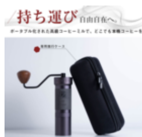
持ち運び自由自在