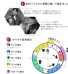
有名バリスタに実際に使っていただきました