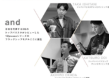
トップバリスタ三名のご紹介