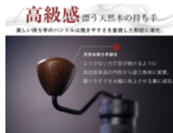
高級感のある持ち手