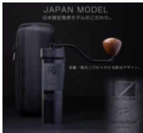
日本限定デザイン