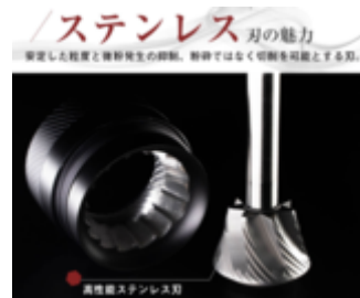
ステンレス刃の魅力