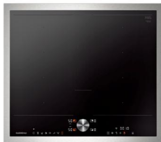
IHクッキングヒーター