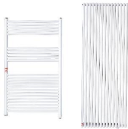
パネルヒーター参考写真