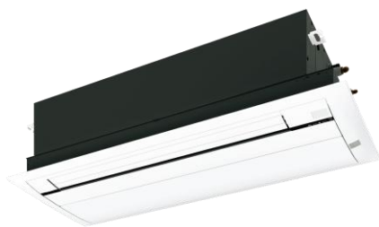
天井カセットエアコン参考写真