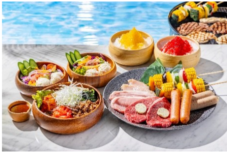
「ランチバーベキューセット」(写真は2名様分)

きらめくプールを目の前に望み、緑鮮やかな木立に囲まれたリゾート感あふれるテラス席で、国産牛やシーフードなどを楽しめるバーベキュープランが登場します。準備や後片付けの手間なく、家族や友人、グループで気軽に夏の食事をお楽しみいただけます。